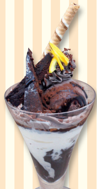
ブラウニー チョコレートパフェ 790円(税込869円)