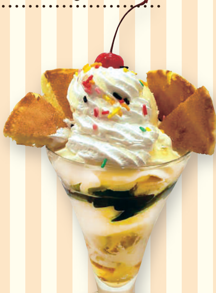
ふわふわ パンケーキパフェ 620円(税込682円)