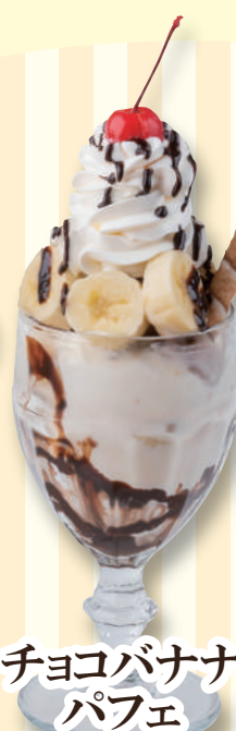
チョコバナナ パフェ 590円(税込649円)