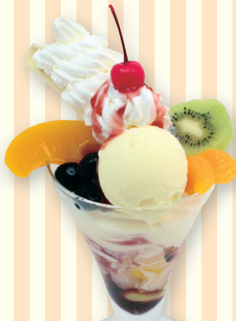
フルーツと パンナコッタのパフェ 620円(税込682円)