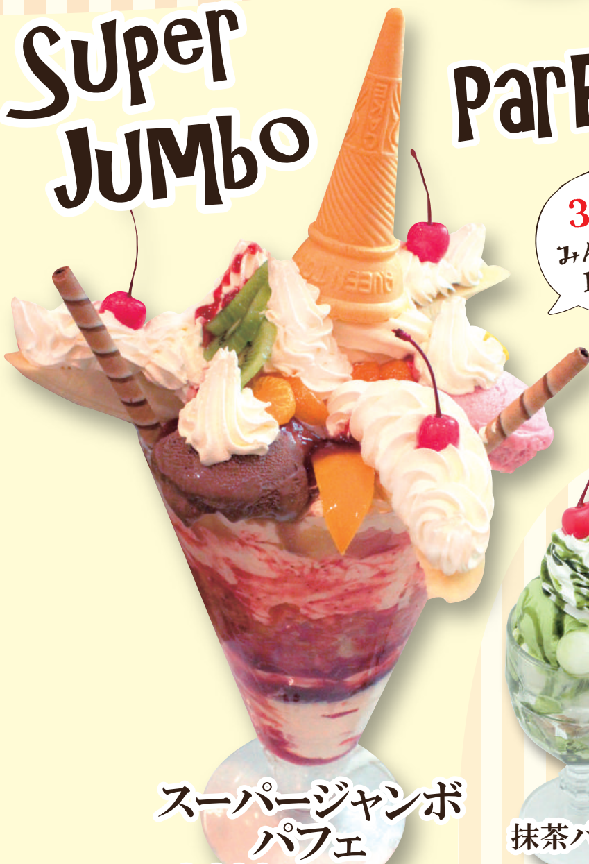
スーパージャンボ パフェ 2,990円(税込3,289円)