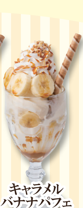
キャラメル バナナパフェ 590円(税込649円)