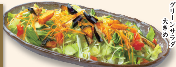
グリーンサラダ 大きめ