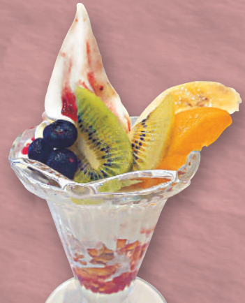
ミニフルーツ パフェ 520円(税込572円)