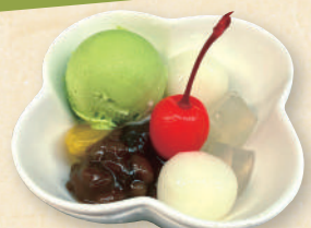
ミニあんみつ 各280円(税込308円)