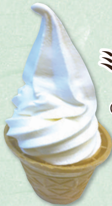
ミニソフト 190円 (税込209円)