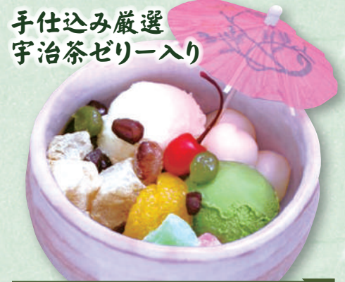
手仕込み厳選 宇治茶ゼリー入り