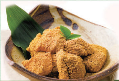
わらび餅 520円(税込572円)