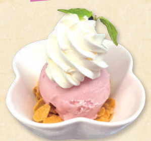
ミニアイス 各240円(税込264円)