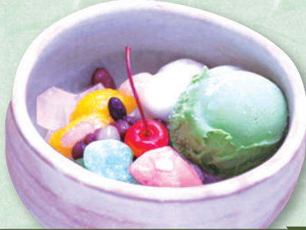
抹茶あんみつ 620円(税込682円)