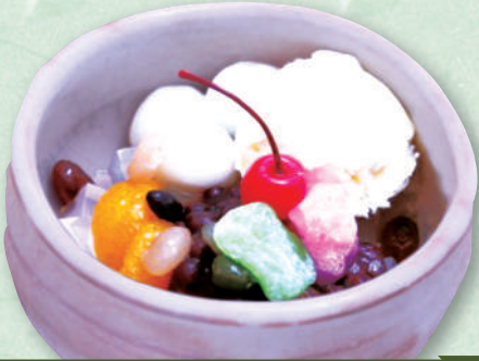
クリームあんみつ 620円(税込682円)