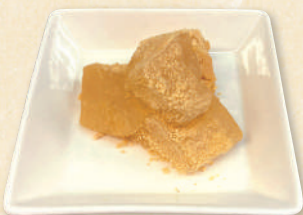
ミニわらび餅 200円(税込220円)