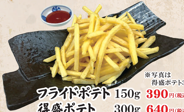
フライドポテト 150g 390円(税込429円) 得盛ポテト 300g 640円(税込704円)