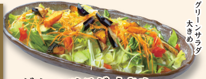
グリーンサラダ 大きめ