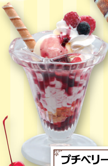
プチベリーパフェ 520円 (税込572円)