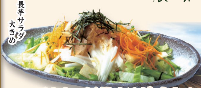
長芋サラダ 大きめ