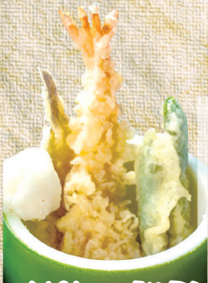
天ぷら3点盛り 390円(税込429円)