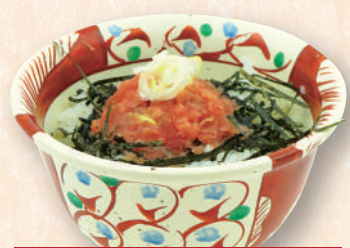
ハーフネギトロ井