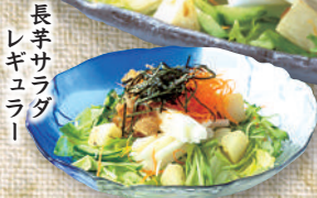
長芋 サラダ レギュラー