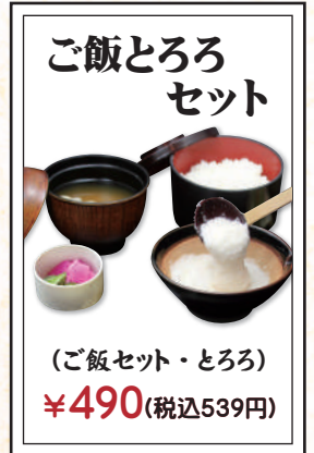
ご飯とろろ セット