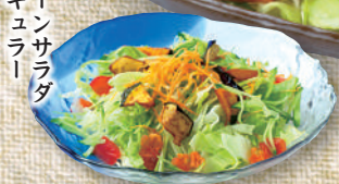
グリーン サラダ レギュラー