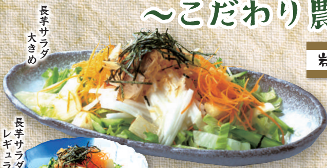
長芋 サラダ 大きめ