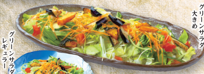
グリーン サラダ 大きめ