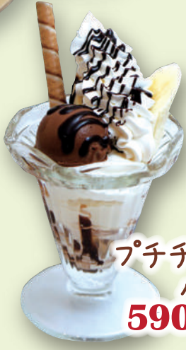
プチチョコバナナ パフェ 590円(税込649円)