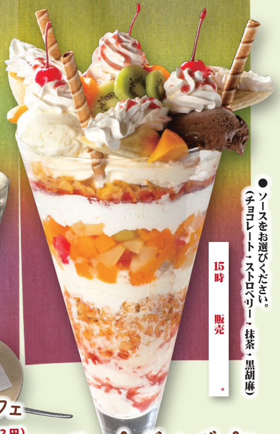
スーパージャンボパフェ 2,980円(税込3,278円)