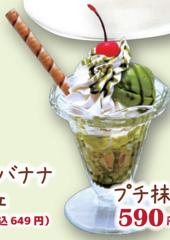
プチ抹茶パフェ 590円(税込649円)