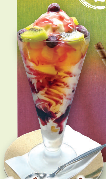
チーズベリーパフェ 820円(税込902円)