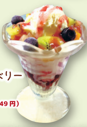
プチチーズベリー パフェ 590円(税込649円)