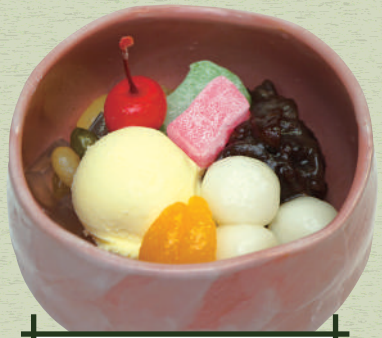
クリームあんみつ 抹茶あんみつ 690円(税込759円)