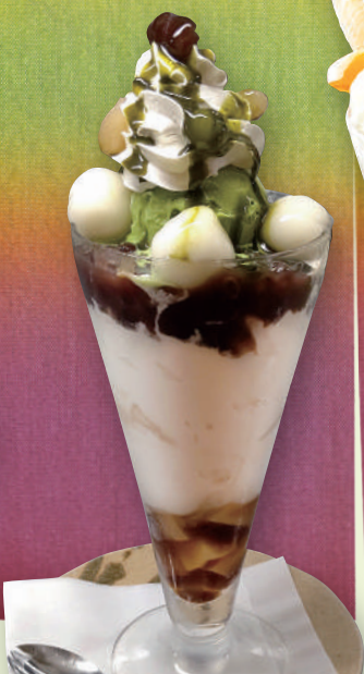
抹茶パフェ 820円(税込902円)