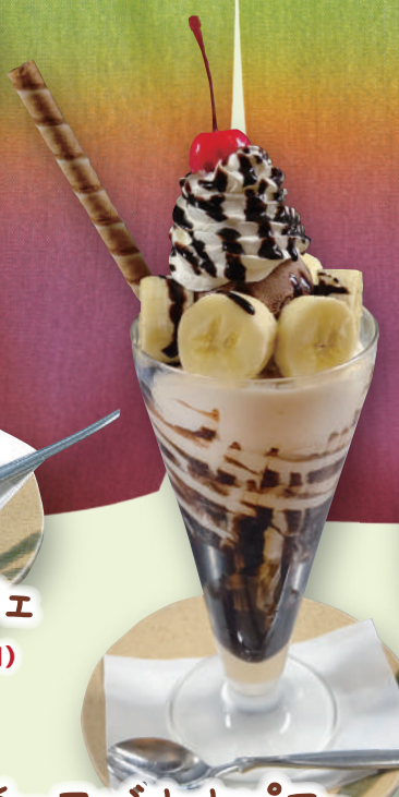
チョコバナナパフェ 820円(税込902円)