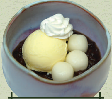
クリームぜんざい 690円(税込759円)