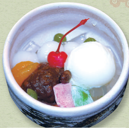
クリーム あんみつ 620円 (税込682円)