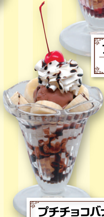
プチチョコバナナパフェ 520円 (税込572円)