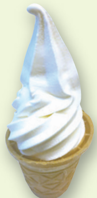
ミニソフト 190円(税込209円)