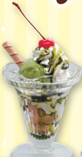
プチ抹茶パフェ 520円 (税込572円)