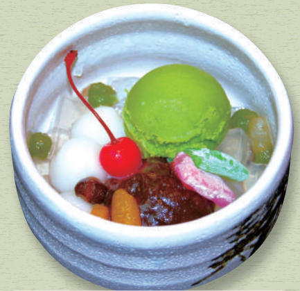
抹茶 あんみつ 620円 (税込682円)