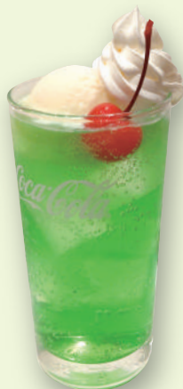
クリームソーダ 490円(税込539円)