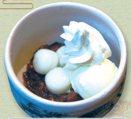
クリーム ぜんざい 620円 (税込682円)