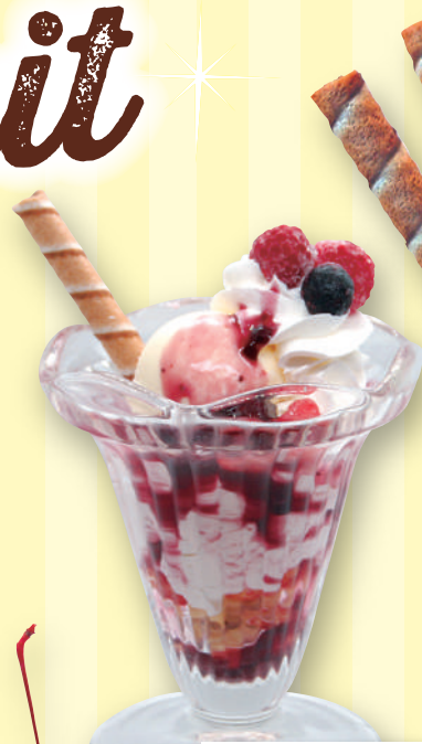
プチベリーパフェ 520円 (税込572円)