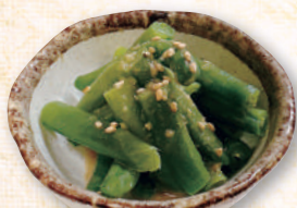
いんげんの胡麻和え