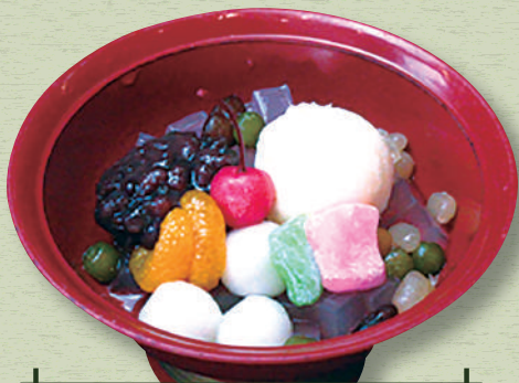
クリームあんみつ 620円(税込682円)