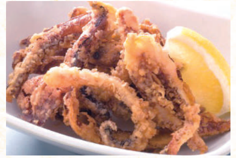
イカゲソの唐揚げ 450円(税込495円)