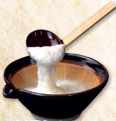
長芋とろろ 190円(税込209円)