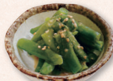
いんげんの胡麻和え