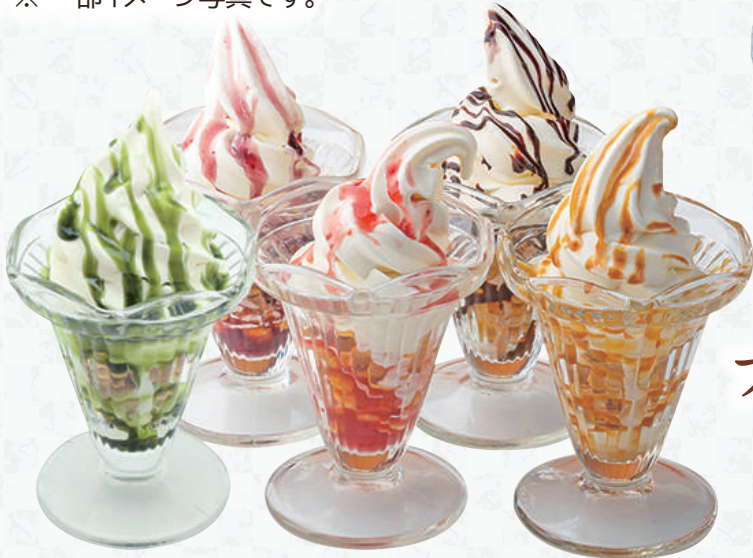
ミニパフェ 各290円(税込319円)