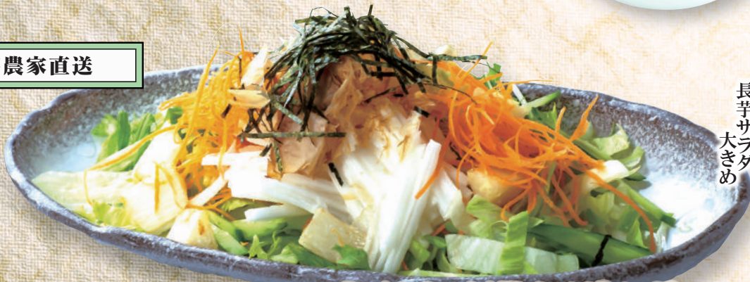
長芋サラダ 大きめ