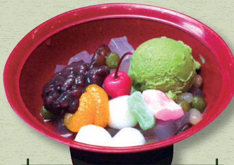
抹茶あんみつ 620円(税込682円)