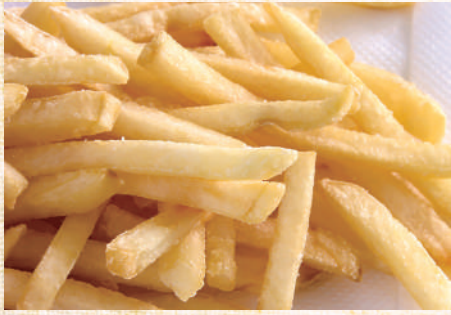
フライドポテト 290円(税込319円)