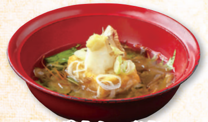
揚げ出し豆腐 350円(税込385円)