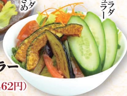
グリーンサラダ 大きめ