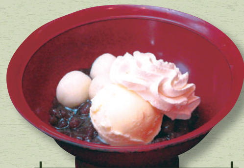
クリームぜんざい 590円(税込649円)