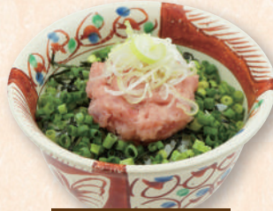
ハーフ ねぎとろ丼