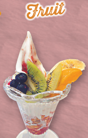
ミニフルーツ パフェ 520円(税込572円)