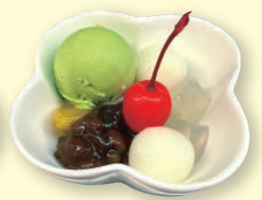
ミニアイス 各240円(税込264円)