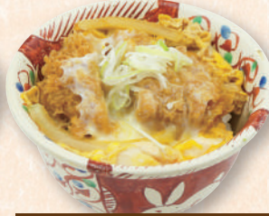
ハーフひれかつ 玉子とじ丼