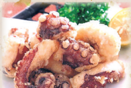
たこの唐揚げ 590円(税込649円)