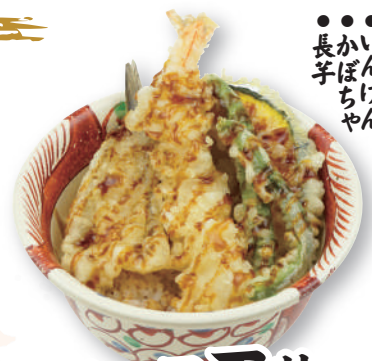
ハーフ天丼 590円(税込649円)