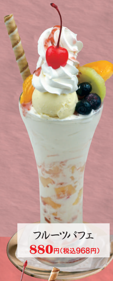
フルーツパフェ 880円(税込968円)