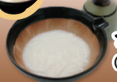
長芋とろろ (お出汁付) 290円(税込319円)