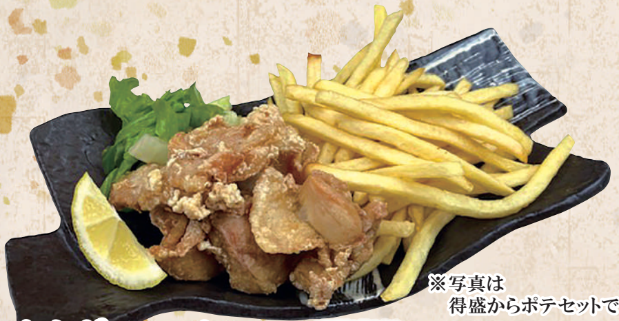
からポテセット 得盛からポテセット