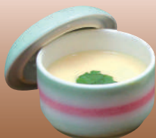
茶碗蒸し 200円(税込220円)