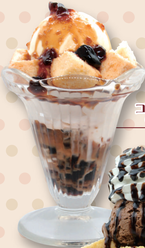
コーヒーゼリー Coffee jelly