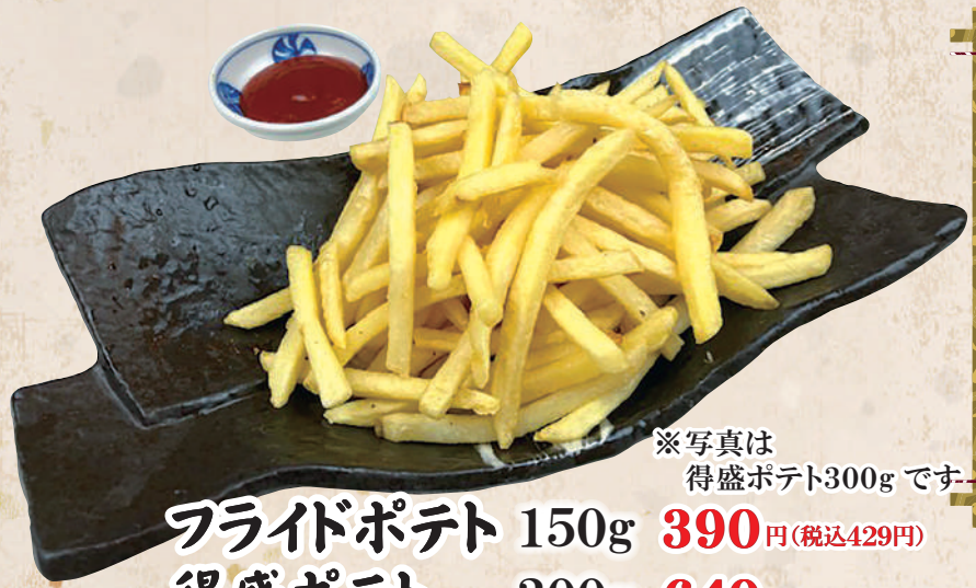
フライドポテト 150g 390円(税込429円) 得盛ポテト 300g 640円(税込704円)