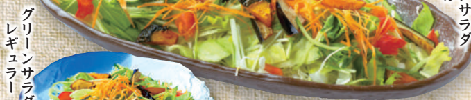
グ リ ン サ ラ ダ 大 き め