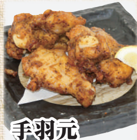
手羽元 黒胡椒焼き

1個 ¥270 (税込297円) 3個 ¥690 (税込759円) 5個 ¥1,090 (税込1,199円)