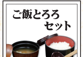
ご飯とろろ セット