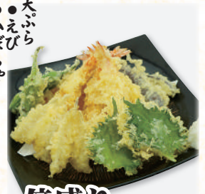
倍盛り 天ぷら盛合せ