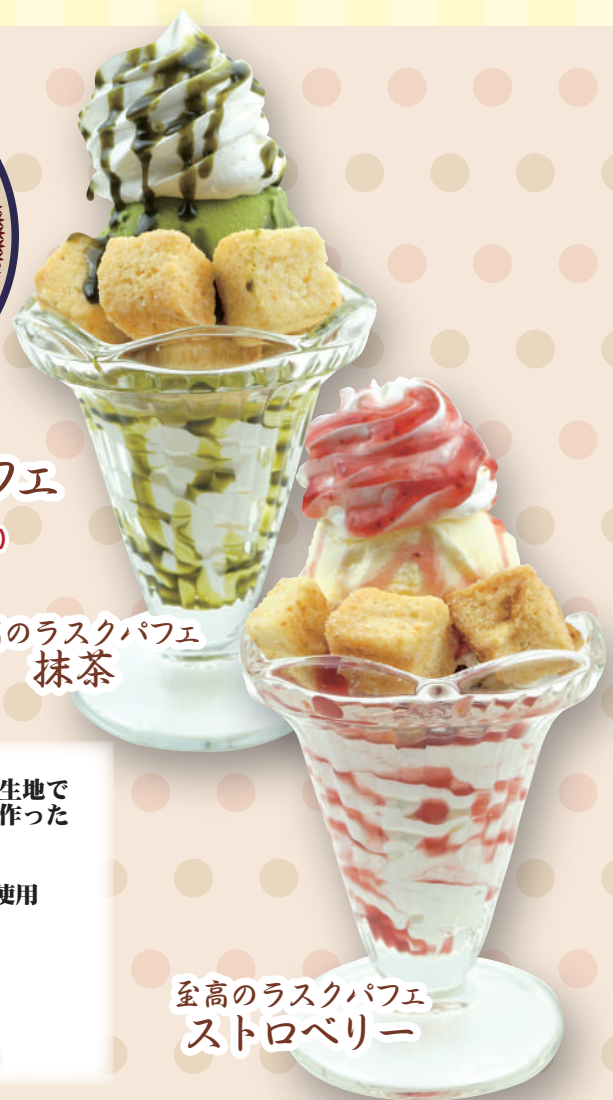
最高のラスクパフェ ストロベリー