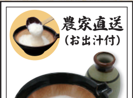
農家直送 (お出汁付)