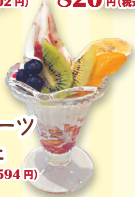
ミニフルーツ パフェ 540円(税込594円)