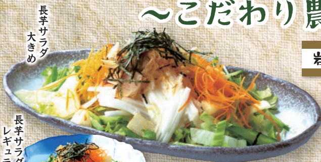
長芋 サラダ 大きめ