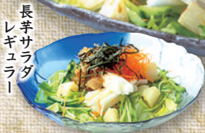
長芋 サラダ レギュラー