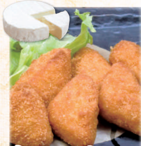
カマンベール チーズフライ