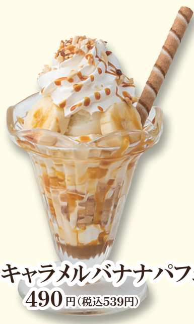
プチキャラメルバナナパフェ 490円(税込539円)