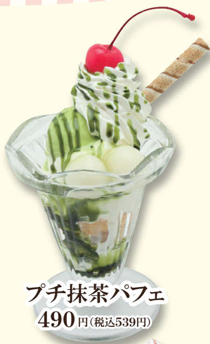
プチ抹茶パフェ 490円(税込539円)