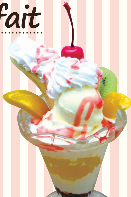
プチフルーツパフェ 540円(税込594円)