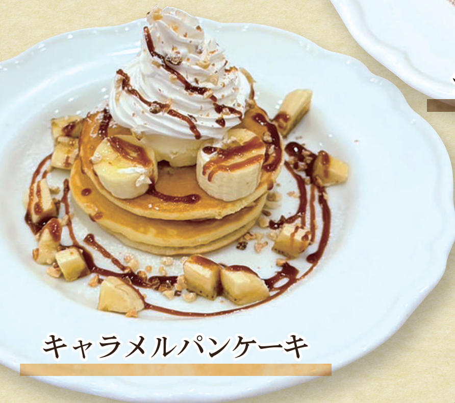
キャラメルパンケーキ