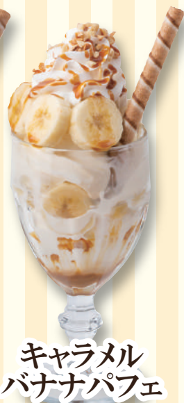
キャラメル バナナパフェ 590 円(税込649円)