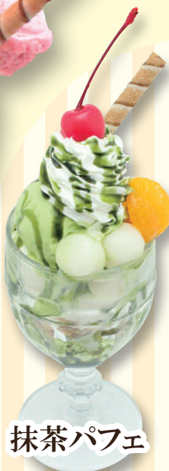
抹茶パフェ 590 円(税込649円)