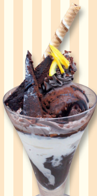
ブラウニー チョコレートパフェ 790 円(税込869円)