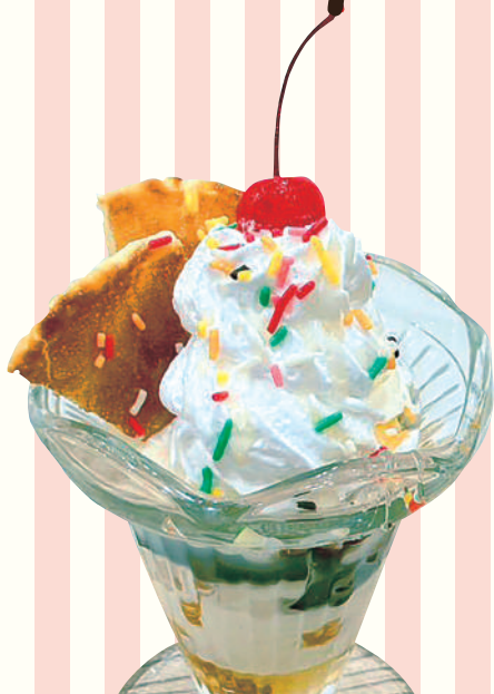
プチふわふわ パンケーキパフェ 540円(税込594円)