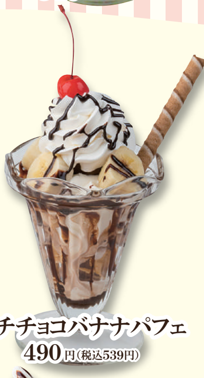
プチチョコバナナパフェ 490円(税込539円)