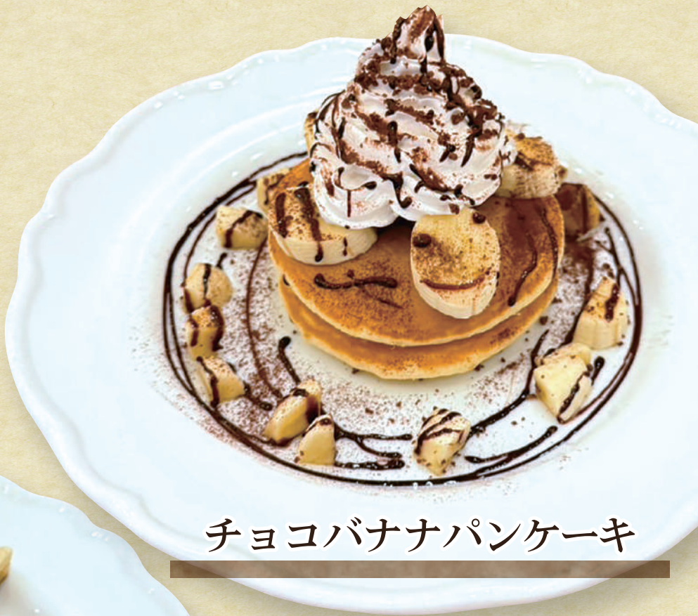
チョコバナナパンケーキ