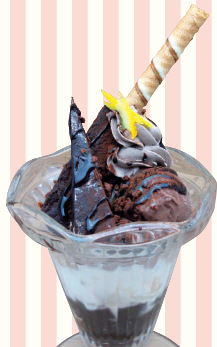
プチブラウニー チョコレートパフェ 690円(税込759円)