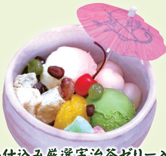
手仕込み厳選宇治茶ゼリー入り