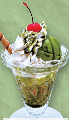
プチ抹茶パフェ 490円(税込539円)