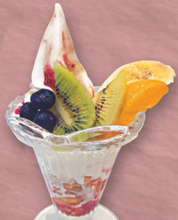
ミニフルーツ パフェ 520円(税込572円)