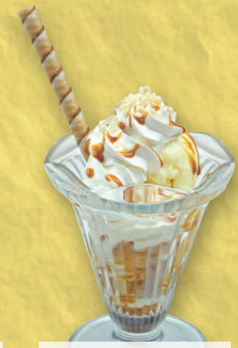
プチキャラメル パフェ 490円(税込539円)