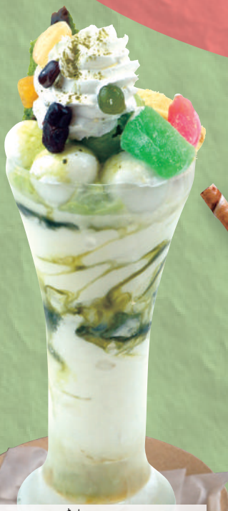
抹茶極みパフェ 820円(税込902円)