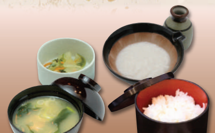
ご飯とろろセット