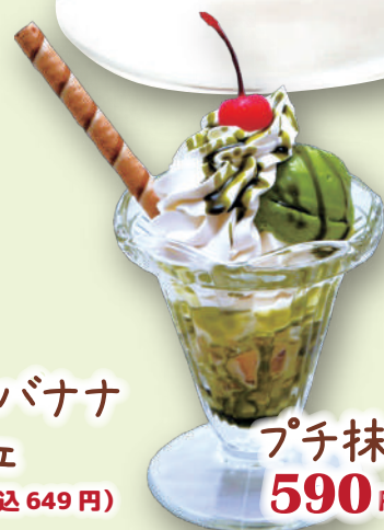
プチ抹茶パフェ 590 円 (税込 649 円)