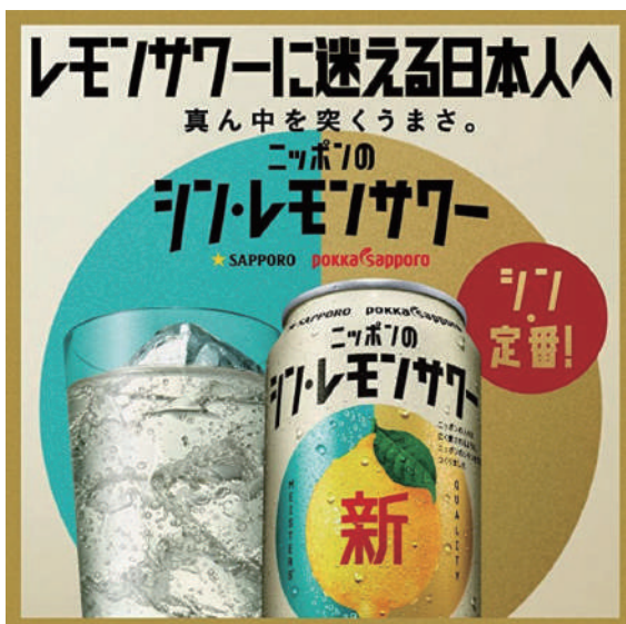
迷わず選べる「シン・定番」 ニッポンのシン・レモンサワー