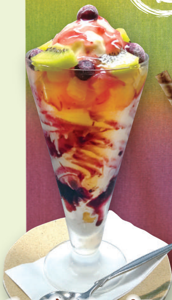
チーズベリーパフェ 820 円 (税込 902 円)