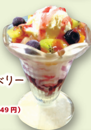
プチチーズベリー パフェ 590 円 (税込 649 円)