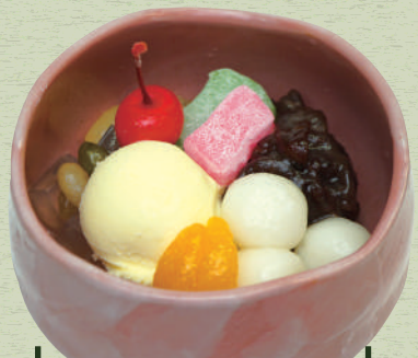
クリームあんみつ 抹茶あんみつ 690 円 (税込 759 円)