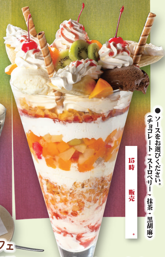
スーパージャンボパフェ 2,980 円 (税込 3,278 円)