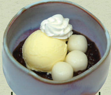
クリームぜんざい 690 円 (税込 759 円)