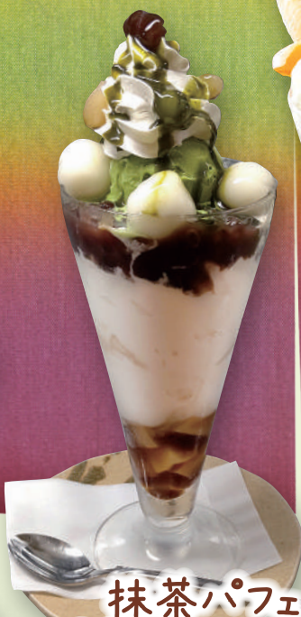
抹茶パフェ 820 円 (税込 902 円)