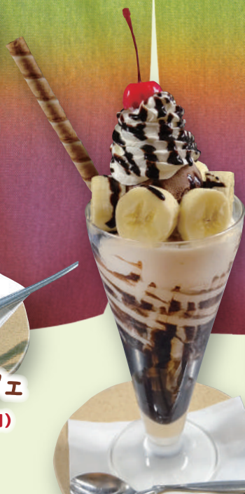
チョコバナナパフェ 820 円 (税込 902 円)