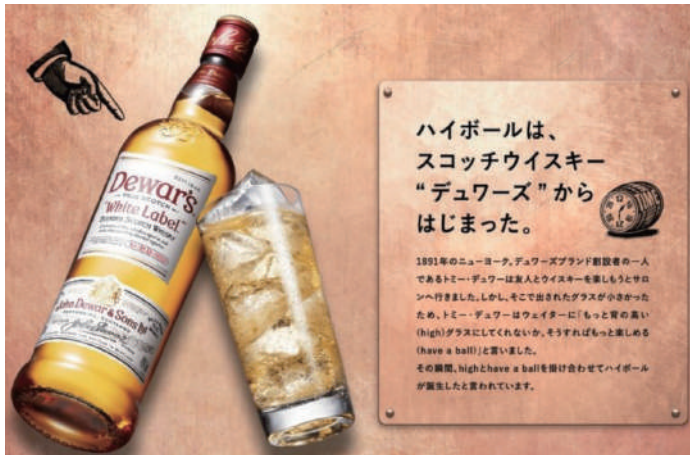
ハイボールの起源 デュワーズハイボール