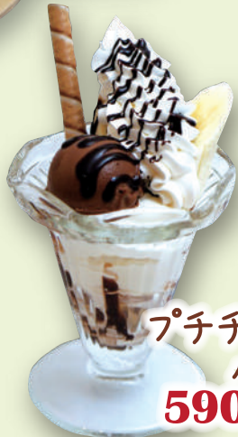
プチチョコバナナ パフェ 590 円 (税込 649 円)