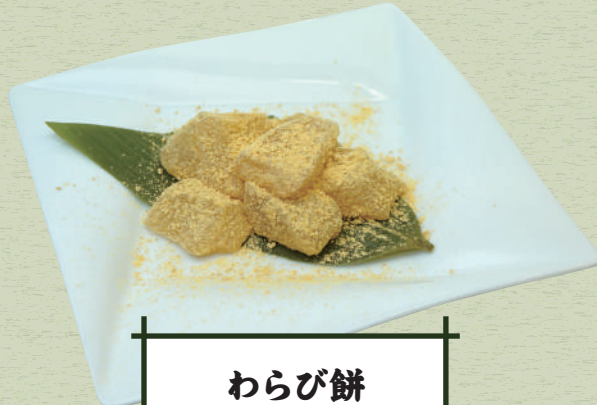
わらび餅 590 円 (税込 649 円)