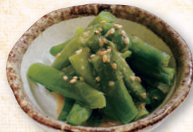
いんげんの胡麻和え