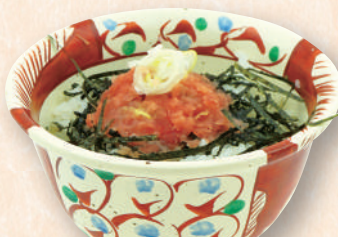
ハーフネギトロ丼