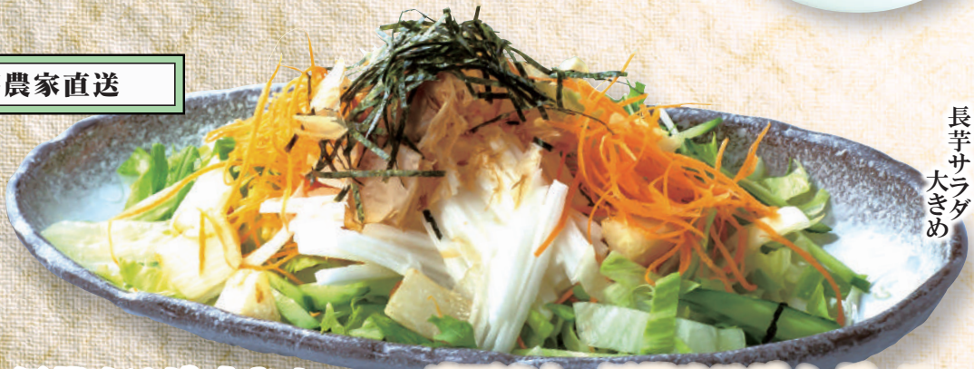
長芋サラダ 大きめ