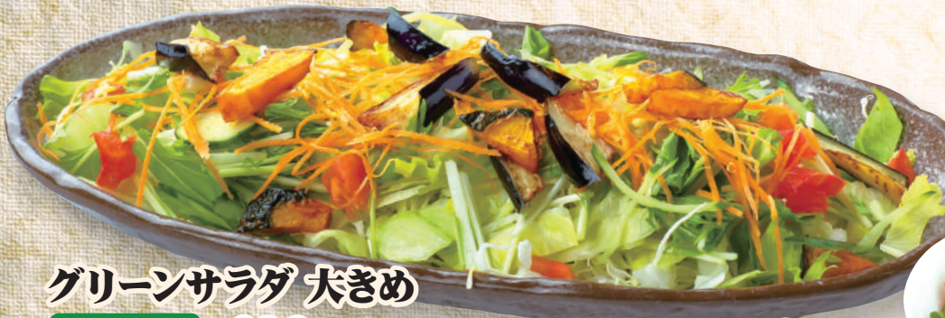
グリーンサラダ 大きめ