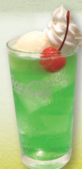
クリームソーダ 490円(税込539円)