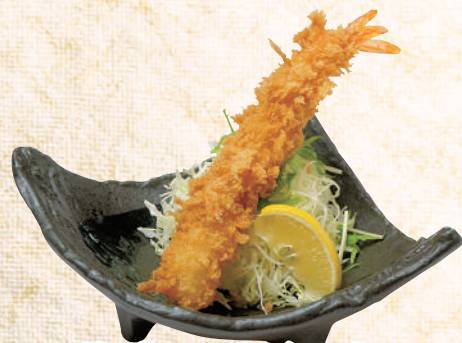
海老フライ1本 390 円(税込429円)