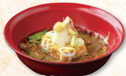
揚げ出し豆腐 350 円(税込385円)