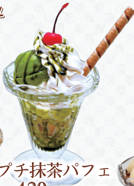
プチ抹茶パフェ 420円(税込462円)