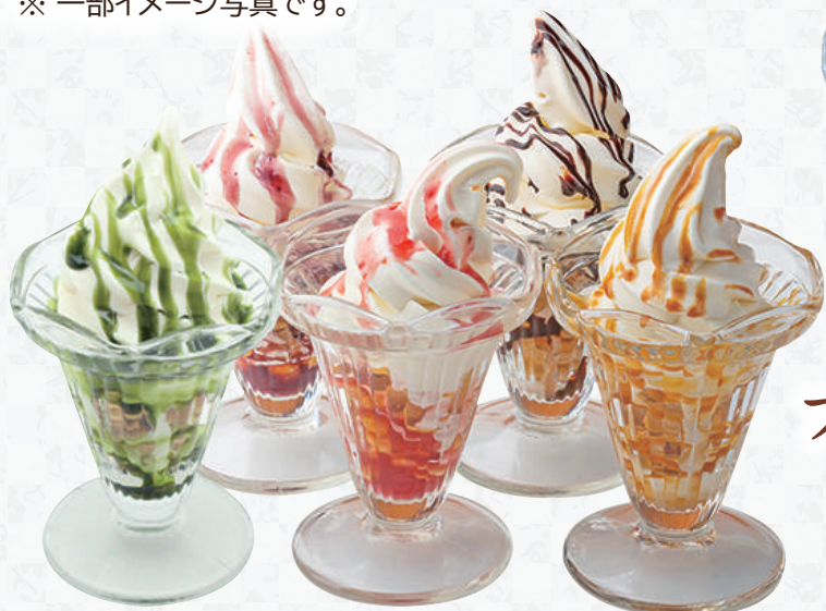
ミニパフェ 各290円(税込319円)