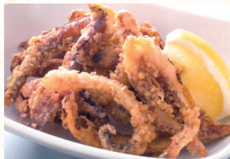
イカゲソの唐揚げ 450 円(税込495円)