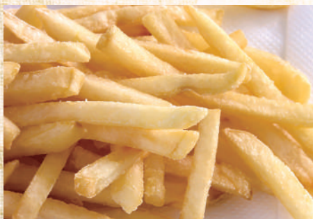
フライドポテト 290 円(税込319円)