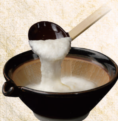
長芋とろろ 190 円(税込209円)