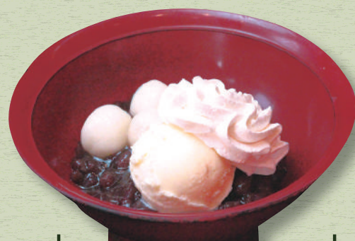
クリームぜんざい 590円(税込649円)