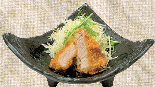
ひれかつ 1枚 300 円(税込330円)