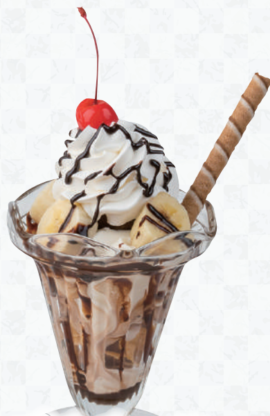
プチチョコ バナナパフェ 490円(税込539円)