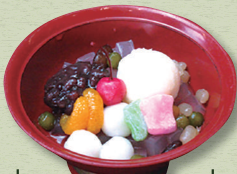
クリームあんみつ 620円(税込682円)