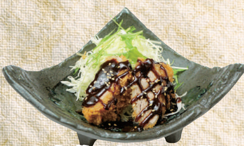
味噌ひれかつ1枚 300 円(税込330円)