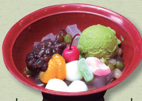
抹茶あんみつ 620円(税込682円)