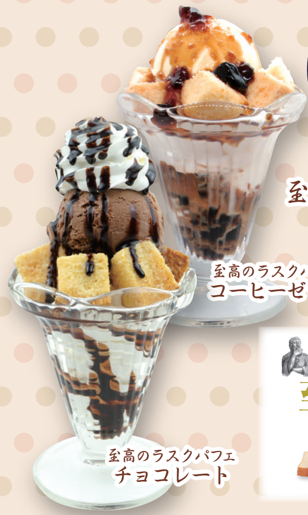
至高のラスクパフェ チョコレート