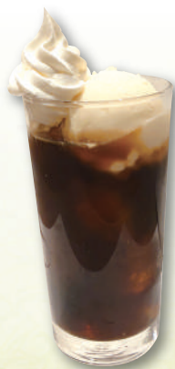
コーヒー フロート 490円(税込539円)