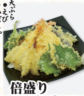
倍盛り 天ぷら盛合せ