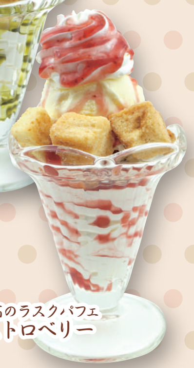
至高のラスクパフェ ストロベリー