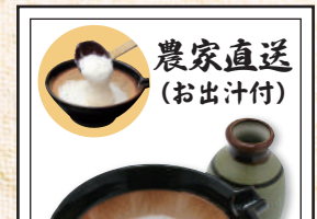
農家直送 (お出汁付)