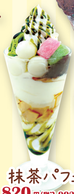
抹茶パフェ 820 円(税込 902 円)