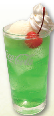
クリームソーダ 490円(税込539円)