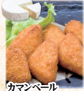
カマンベール チーズフライ