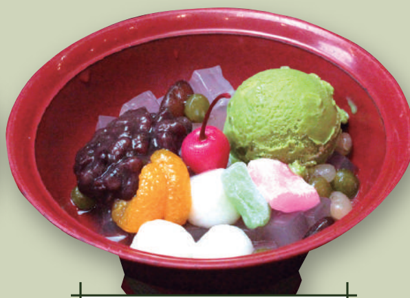
抹茶あんみつ 620円(税込682円)