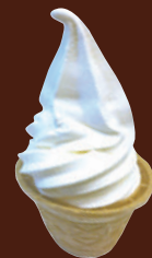
ミニソフト 190円 (税込209円)