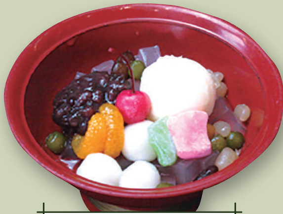
クリームあんみつ 620円(税込682円)