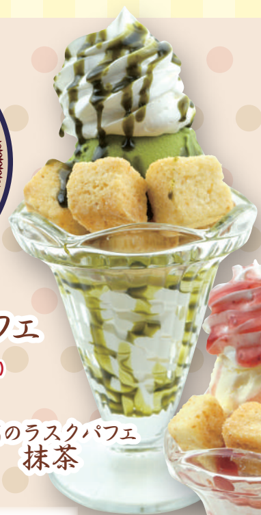
至高のラスクパフェ 抹茶