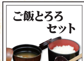
ご飯とろろ セット