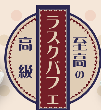
至高のラスクパフェ 各 590 円(税込 649 円)