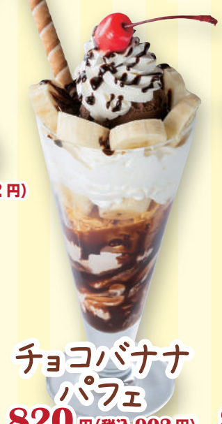
チョコバナナ パフェ 820 円(税込 902 円)