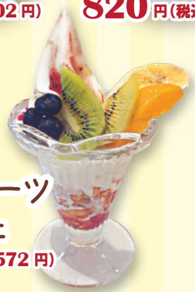
ミニフルーツ パフェ 520 円(税込 572 円)