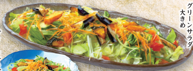
グリーンサラダ 大きめ