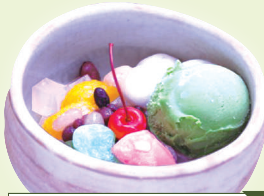
抹茶あんみつ 620円(税込682円)