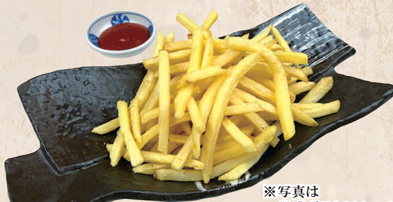
※写真は 得盛ポテト300gです フライドポテト 150g 390円(税込429円)