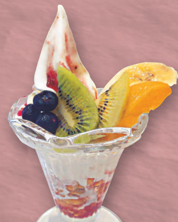
ミニフルーツ パフェ 520円(税込572円)