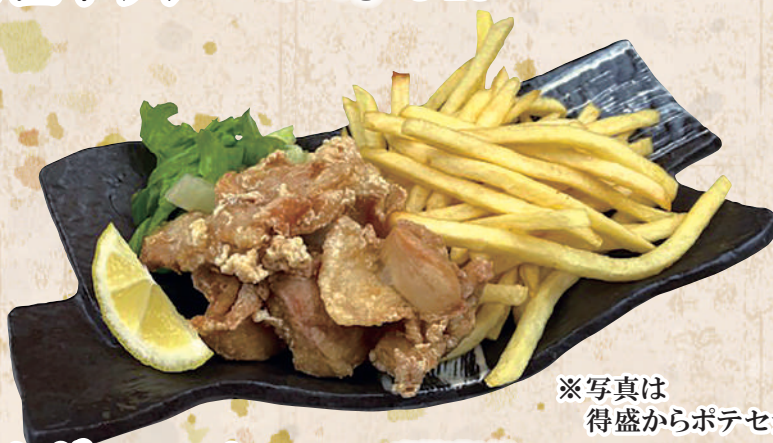
※写真は 得盛からポテセットです からポテセット