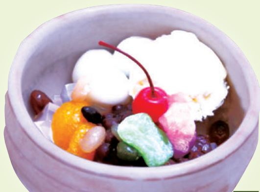
クリームあんみつ 620円(税込682円)