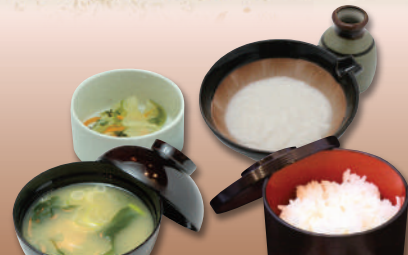
ご飯とろろセット