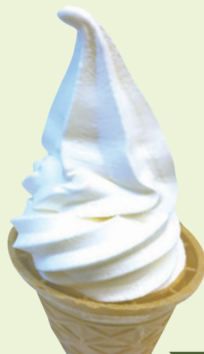
ミニソフト 190円(税込209円)