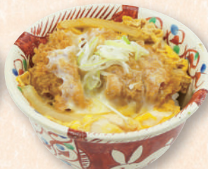
ハーフひれかつ 玉子とじ丼