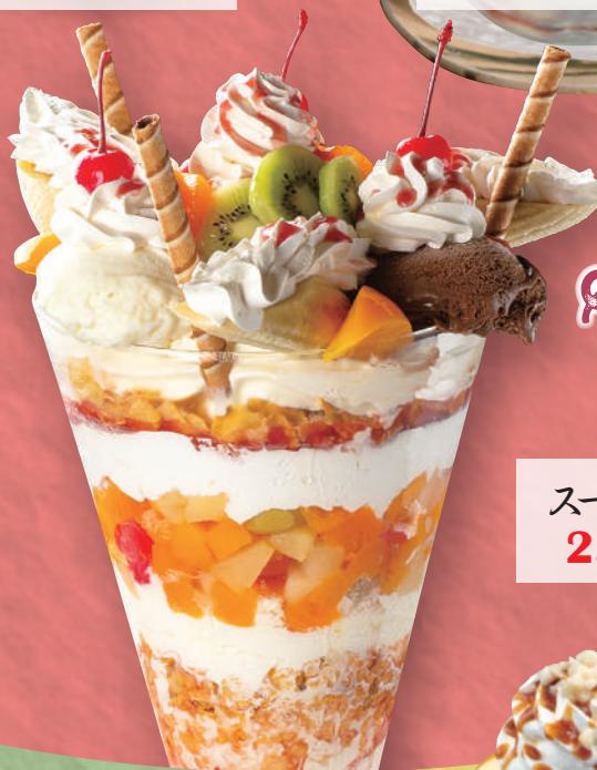
スーパージャンボパフェ 2,980円(税込3,278円)