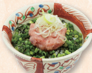
ハーフ ねぎとろ丼