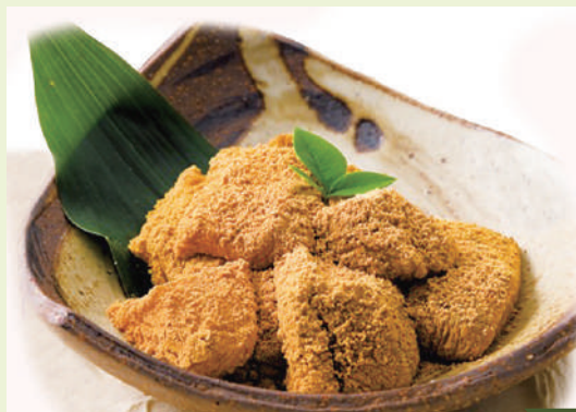
わらび餅 520円(税込572円)