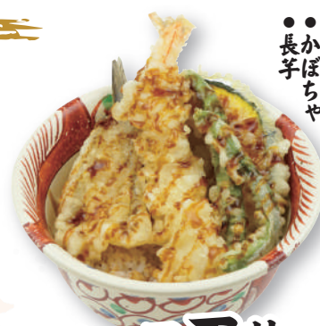
ハーフ天丼 590円(税込649円)