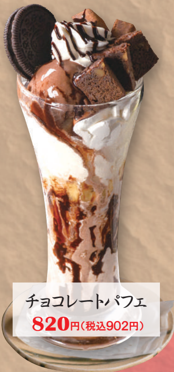
チョコレートパフェ 820円(税込902円)