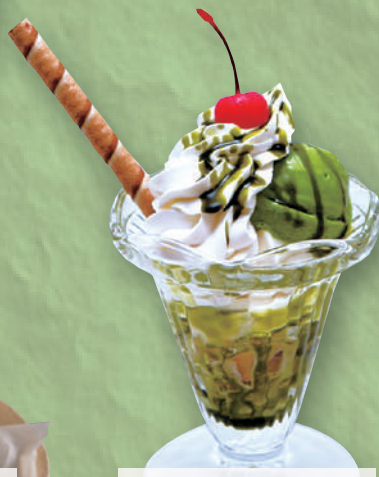
プチ抹茶パフェ 490円(税込539円)