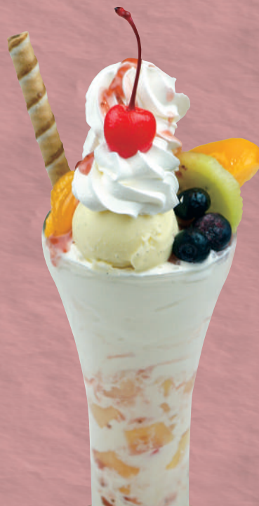
フルーツパフェ 880円(税込968円)