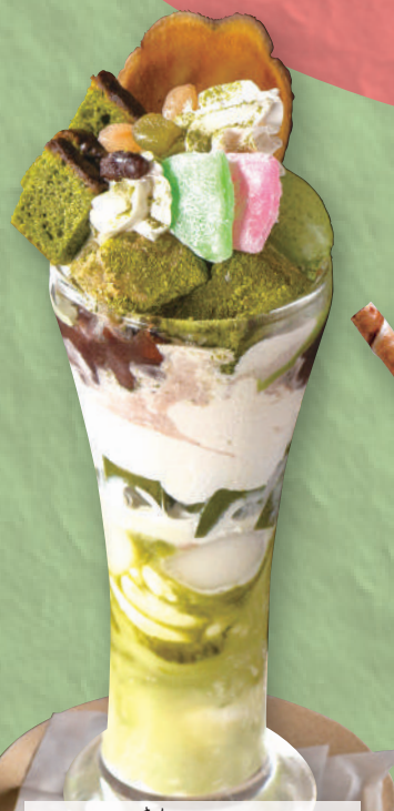
抹茶極みパフェ 820円(税込902円)