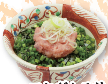
ハーフねぎとろ丼 690円(税込759円)