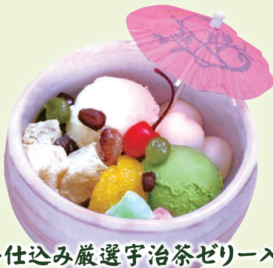
手仕込み厳選宇治茶ゼリー入り