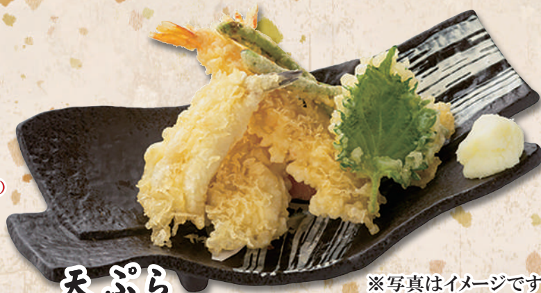
※写真はイメージです 天ぷら