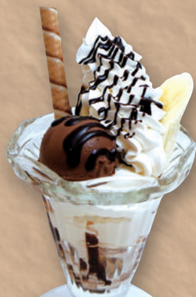
プチチョコバナナ パフェ 490円(税込539円)