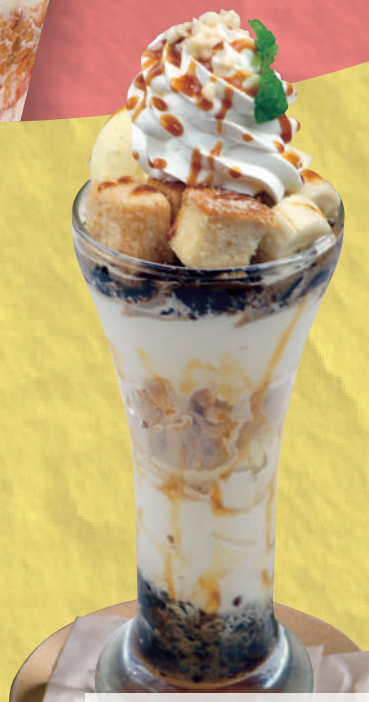
塩キャラメルバナナ パフェ 820円(税込902円)