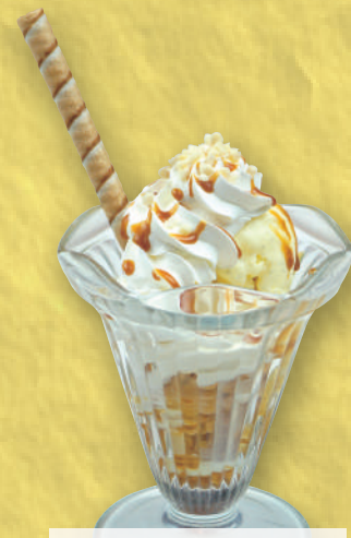
プチキャラメル パフェ 490円(税込539円)