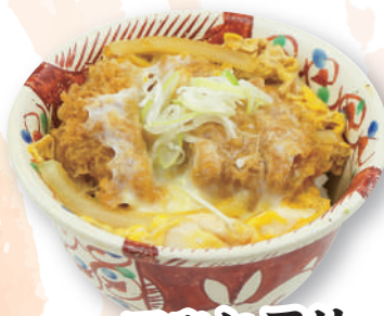
ハーフひれ玉丼 590円(税込649円)