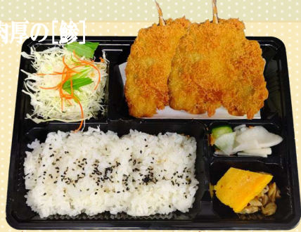
鱈フライ二枚盛り弁当 980円(税込)