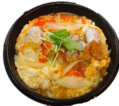
ひれかつ 玉子とじ丼 700円(税込)