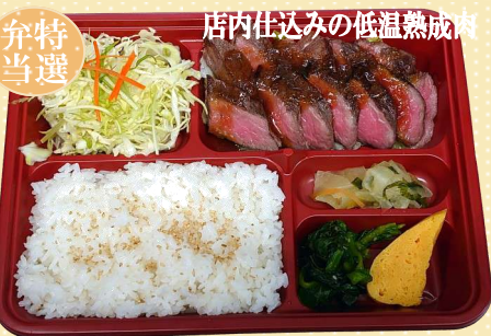
牛ステーキ弁当 1,000円(税込)