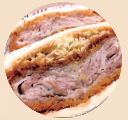
揚げたてジューシー ミルフィーユ カツレツをサンド