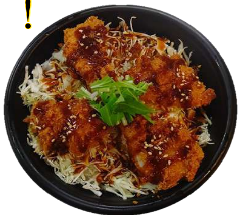
ソースひれかつ丼 500円(税込)