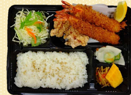
海老から弁当 800円(税込)