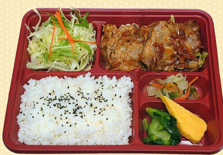
生姜焼き弁当 800円(税込)