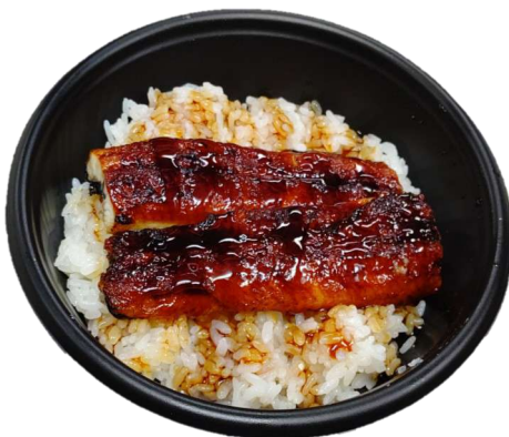
特撰うな丼 1,200円(税込)