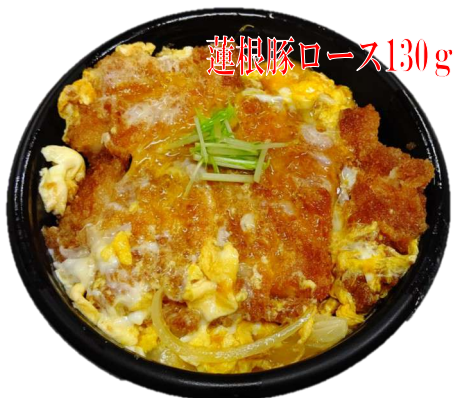
特上かつ丼 1,000円(税込)