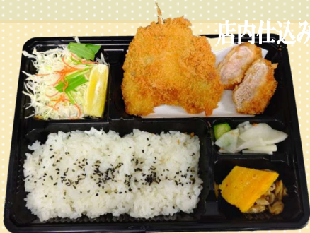
鱈フライ&ひれ弁当 880円(税込)