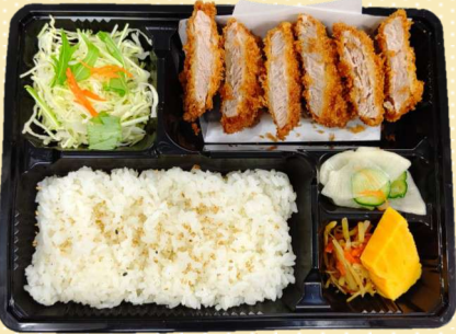
ひれかつ弁当 800円(税込) 味噌ひれかつ弁当 900円(税込)