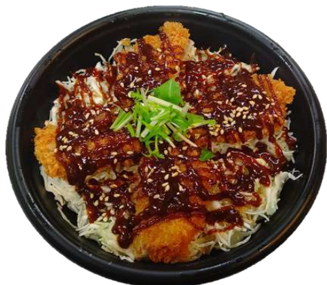
味噌ひれかつ丼 700円(税込)