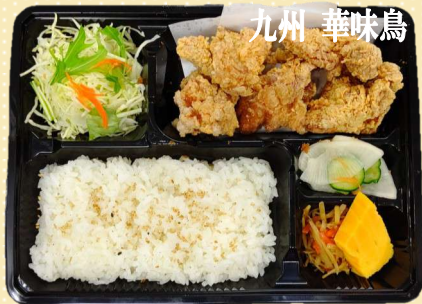
九州 華味鳥 水たき唐揚げ弁当 800円(税込) 水たき唐揚げ南蛮弁当 900円(税込)