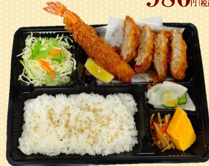
海老ひれ弁当 800円(税込)