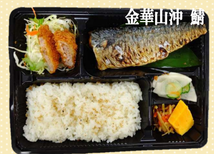
金華山沖 鯖 鯖塩焼き弁当 800円(税込)

イオンモール土浦店 TEL 029-875-6100 *お電話でのご予約可能です。