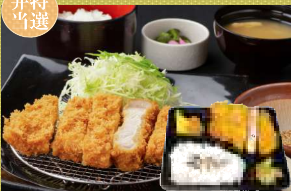
特選 とんかつ弁当 1,080円(税込)