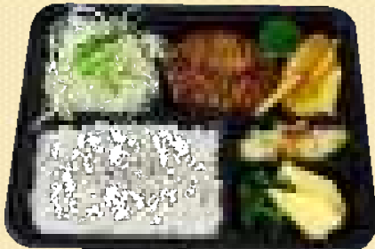
ハンバーグ弁当 980円(税込)