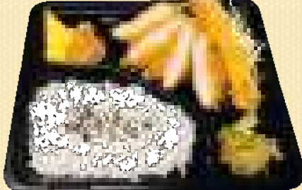
海老ひれかつ弁当 880円(税込)