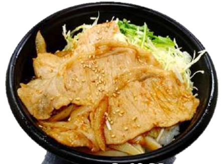
豚口一又生姜焼き丼