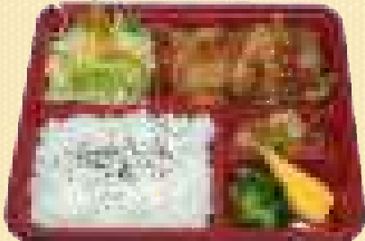
豚生姜焼き弁当 780円(税込)