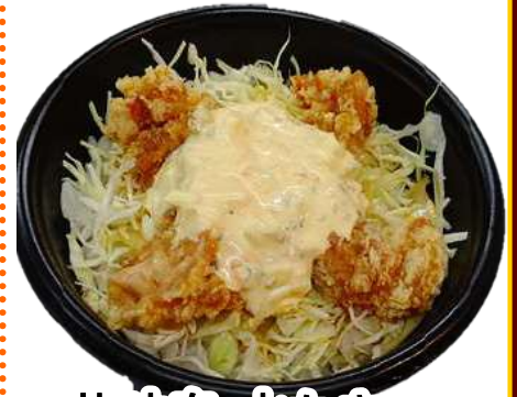
華味鳥水たき 唐揚げ南蛮丼