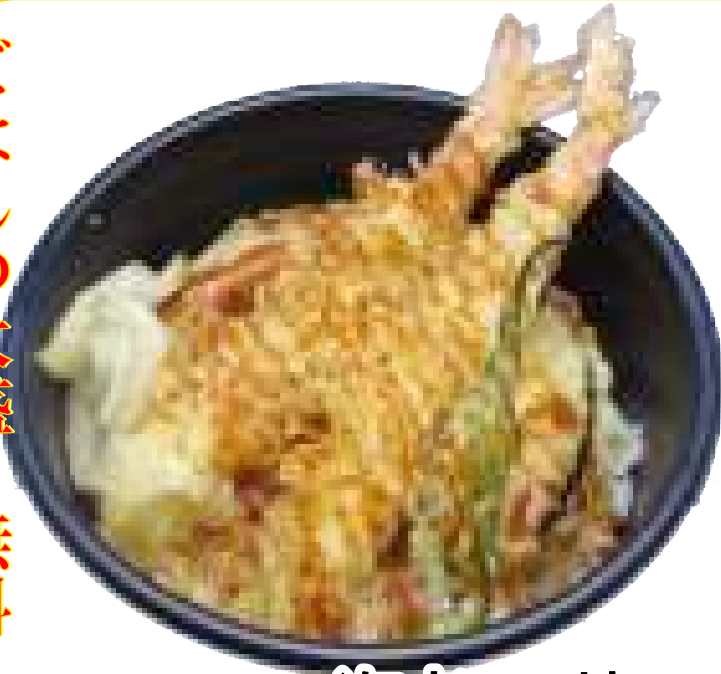
「一番人気」 海老天丼