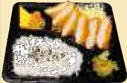
ひれかつ弁当 880円(税込)