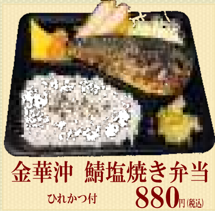
金華沖 鯖塩焼き弁当 880円(税込) ひれかつ付