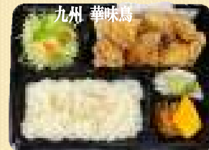
九州 華味鳥 水たき唐揚げ弁当 780円(税込) 水たき唐揚げ南蛮弁当 880円(税込)