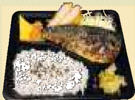
金華沖 鯖塩焼き弁当 880円(税込) ひれかつ付