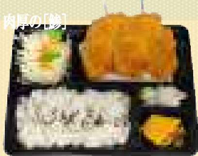
鰻フライ二枚盛り弁当 980円(税込)