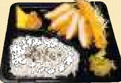
海老ひれかつ弁当 880円(税込)