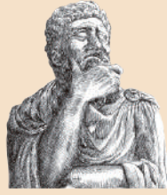
考えた人すごいわ Il est fabuleux, ce créateur.