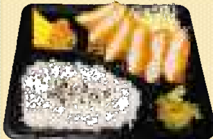
ひれかつ弁当 880円(税込)