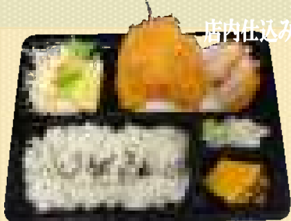
鰻フライ&ひれ弁当 880円(税込)