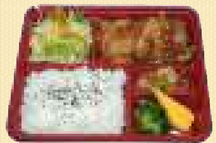
豚生姜焼き弁当 780円(税込)