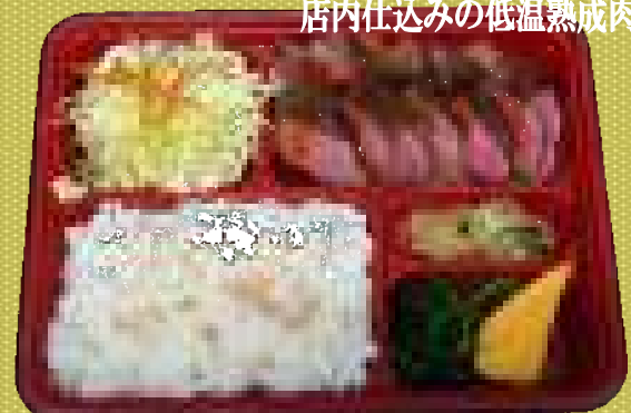
牛ステーキ弁当 1,000円(税込)