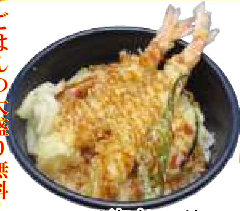
「一番人気」 海老天丼