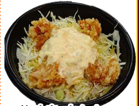
華味鳥水たき 唐揚げ南蛮丼