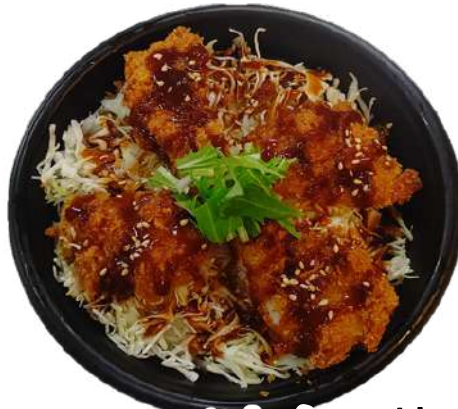
ソースひれかつ丼