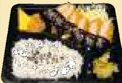
味噌ひれかつ弁当 880円(税込)