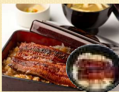
特選 うな井 1,180円(税込)