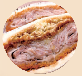
揚げたてジューシー ミルフィーユ カツレツをサンド