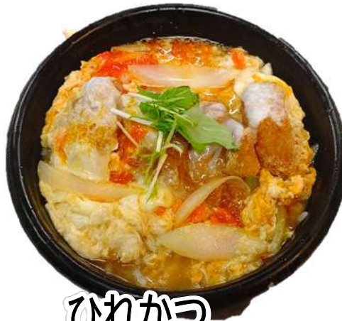
ひれかつ 玉子とじ丼